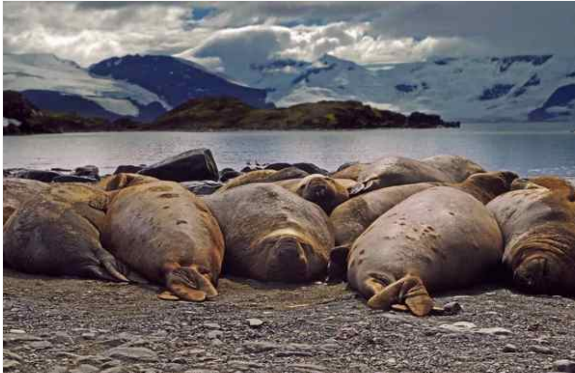
На этом пляже на Сигни поселись морские слоны.

Когда после двухнедельного пребывания на Сигни мы, стоя в воде, грузили нашу поклажу на надувную лодку, молодые морские котики подплывали к ногам, пытаясь укусить. К счастью, им это им ни разу не удалось. Погрузив на корабль экспедиционный багаж, мы отправились в обратное плавание в Чили. Среди встреченных нами айсбергов один оказался весьма коварным: два его пика возвышались над поверхностью океана, а находящаяся между ними часть длиной примерно две мили «пряталась» под водой. Если бы судно направилось в промежуток между вершинами, то неизбежно напоролось бы на подводную часть айсберга.