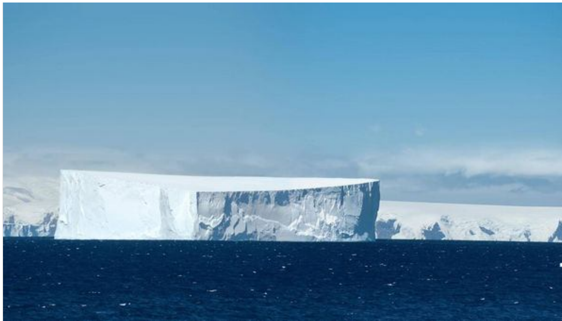
Возле острова Сигни застревают на мелях айсберги.

— Вовсе нет. В мои обязанности входил монтаж антенн (одну из них изготовили по моим чертежам) и некоторого другого оборудования, размещавшегося на окружающих холмах. По плану антенны устанавливались не все сразу, а по мере необходимости, так что у меня каждый день был изрядный объем работы на открытом воздухе. Тем более что сильный ветер то и дело заваливал антенны.